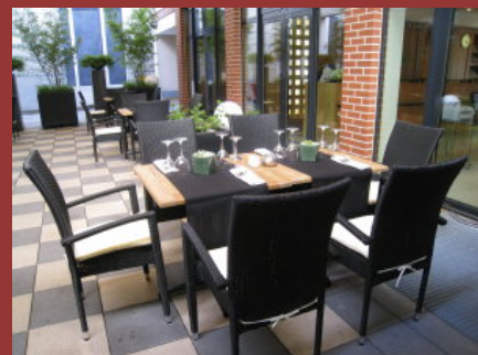
RELAXA HOTEL INNENHOF