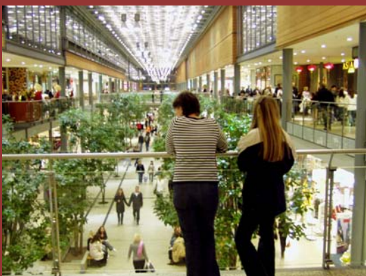
SHOPNIG ARCADE AM POTSDAMMER PLATZ