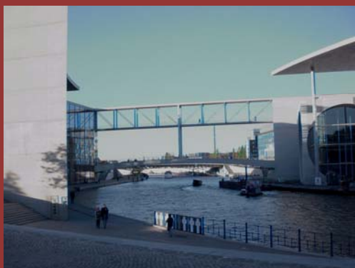
SPREEBOGEN AM KANZLERAMT