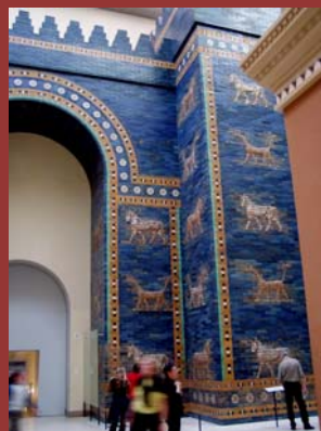
ISTIA TOR IM PERGAMON MUSEUM