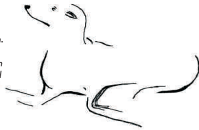
Hundeskizze von Docteur Jacques Millemann